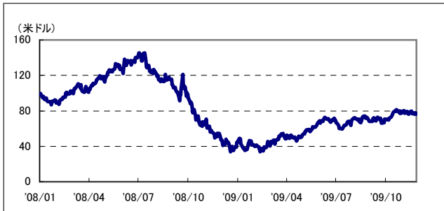
原油WTI先物(期近物)の推移 (2008年1月～前週末)