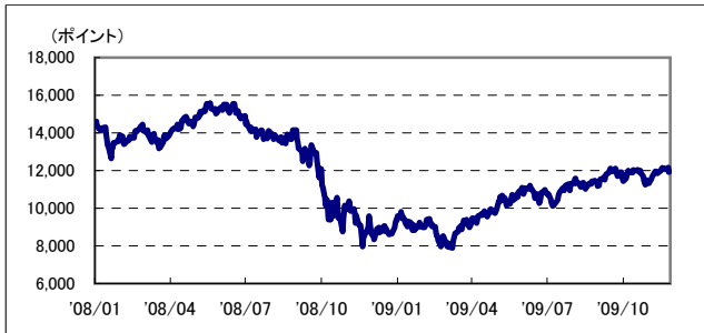
S&Pトロント株価指数の推移 (2008年1月～前週末)